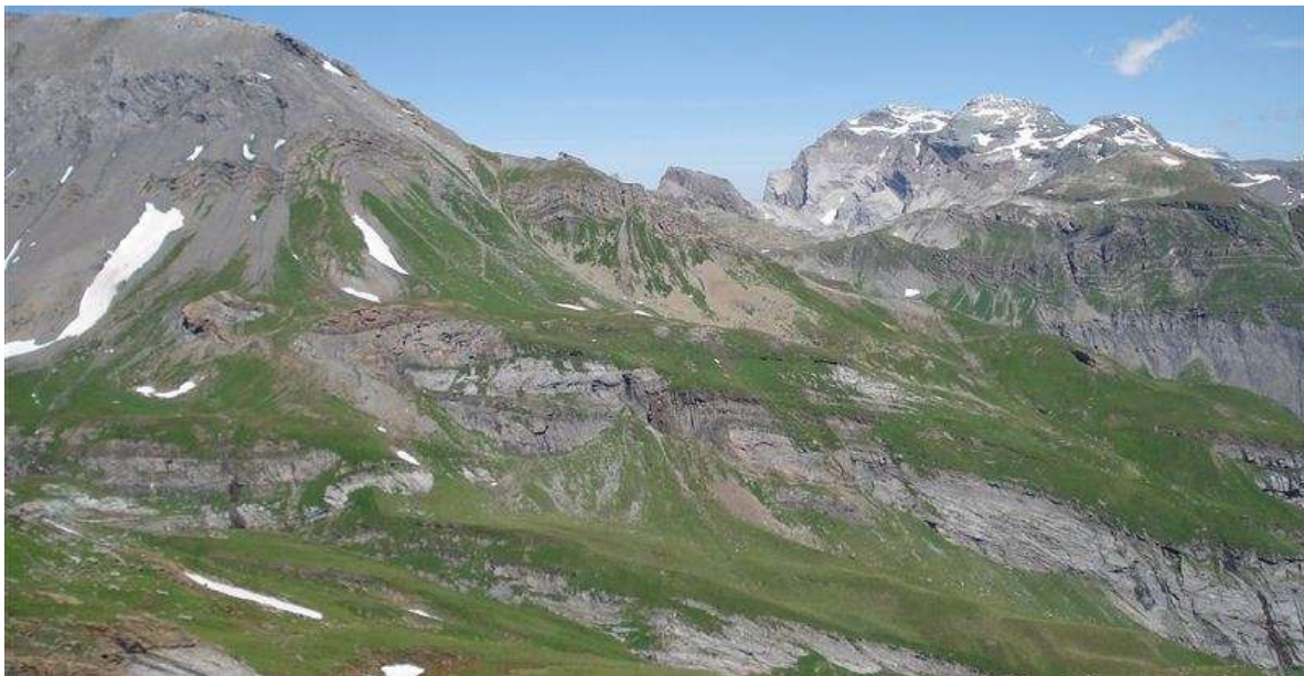
„Herrenloses kulturunfähiges Gebietes im Hochgebirge“: Quellgebiet der oberen Linth

1917 befasste sich eine Kommission des Landrates mit dem Problem des „herrenlosen kulturunfähigen Gebietes im Hochgebirge“. Da im Flussgebiet der oberen Linth, wo das Linth-Limmern-Werk vorgesehen war, grosse Firn- und Felsgebiete sich befinden, war abzuklären, wem das Eigentumsrecht daran gehörte. Eine kantonale Vorschrift dazu gab es nicht. Das eidgenössische Zivilgesetzbuch von 1912 indessen enthielt die Bestimmung, „herrenlose und öffentliche Sachen“ stehen unter der Hoheit des Staates, in dessen Gebiet sie sich befinden, und „an dem der Kultur nicht fähigen Lande“ (wie Felsen, Gletscher usw.) bestehe kein Privateigentum. Regierungsrat und Kommission schlugen vor, das Niemandsland im Flussgebiet der oberen Linth zum Eigentum des Kantons zu erklären. Die Landsgemeinde folgte diesem Antrag.