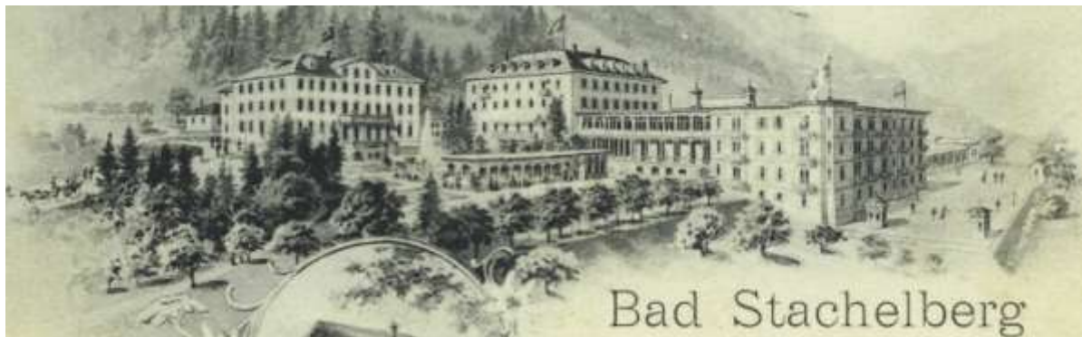
Postkarte (um 1902): Bad Stachelberg, Linthal, mit elektrischem Licht und Zentralheizung ausgestattet

Austern, Schildkrötensuppe, Rheinsalm, Gänseleberschnitten, Rehkoteletten, gefüllte Wachteln, Pouletfilet – aus solchen Hochgenüssen konnte eine Festtagstafel für eine Hochzeitsgesellschaft, die sich im Bad Stachelberg in Linthal ergötzte, bestehen. Der mondäne Kurort befand sich unter jenen, die als Erste elektrisches Licht und Heizwärme ersehnt hatten. Das Bad wusste, was es der Noblesse aus dem In- und Ausland schuldig war und wartete deshalb ungeduldig auf die Inbetriebnahme des Kraftwerks. Das Elektrizitätswerk Linthal, welches das Wasser der Fätschbaches ausnutzte, nahm 1901 seinen Betrieb auf. Nun erhellte das elektrische Licht zahlreiche Stuben und die Strassen. Eine eigens errichtete Hochspannungsleitung für die Zentralheizung und die Beleuchtung der 150 Zimmer erschloss das Bad.