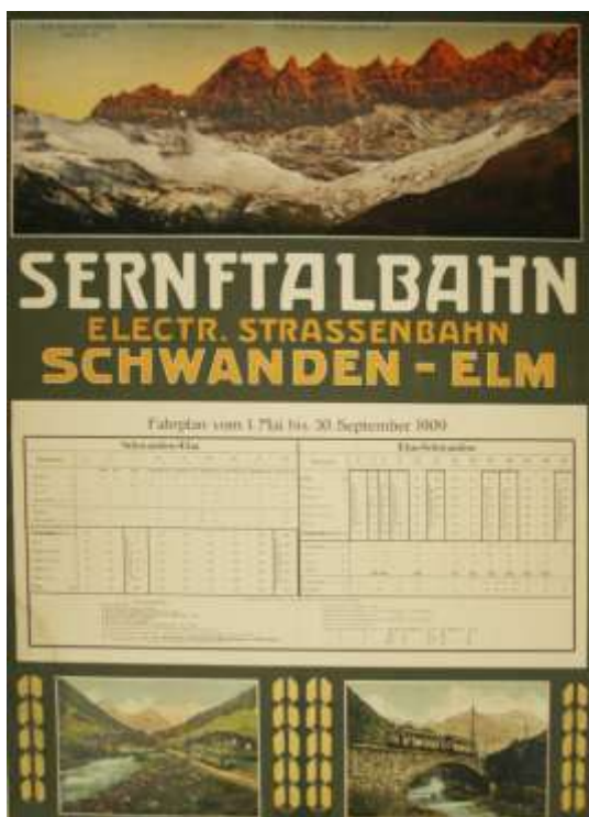
Fahrplan der Sernftalbahn 1909, Plakat

Bei der Diskussion über die Notwendigkeit eines gemeindeeigenen Wasserkraftwerkes Linthal schossen 1899 die Fantasien über die Verwendung des Stroms ins Kraut. Neben der billigen Kraftabgabe an Gemeinde und Private für Beleuchtung und Kleinmotorenbetrieb sollte der Strom weitere Bedürfnisse befriedigen – etwa für eine Bergbahn auf Braunwald (die acht Jahre später ein Linthaler Fabrikant baute), der Bahnstrecke Glarus-Linthal (Elektrifizierung erst 1933) oder eine Strassenbahn über den Klausen. Letztere Idee prallte unweigerlich auf den Umstand, dass die Klausenstrasse, als ein nationales Werk von hoher verkehrswirtschaftlicher und strategischer Bedeutung gewertet, ihrer Vollendung entgegensah (Eröffnung 1900). Ins Reich der Einbildung gehört 1917 auch der Einfall, den ganzen Urnerboden zum Zwecke einer Stauanlage in einem See zu ertränken.