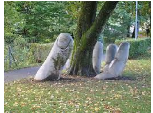
Eva Oertli und Beat Huber: Hand, Beton (Volksgarten)